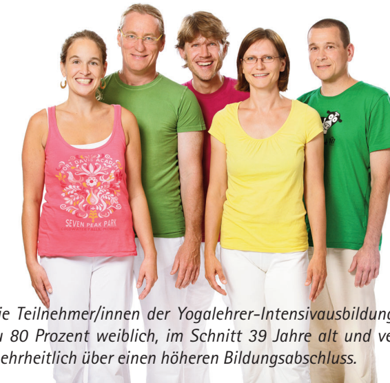
Die Teilnehmer/innen der Yogalehrer-Intensivausbildung waren zu 80 Prozent weiblich, im Schnitt 39 Jahre alt und verfügten mehrheitlich über einen höheren Bildungsabschluss.

Fazit: Intensive Yogapraxis fördert einen gesunden Lebensstil. Der Übende nimmt seine persönlichen Ressourcen bewusster wahr, wird selbstbestimmter und psychisch stabiler.